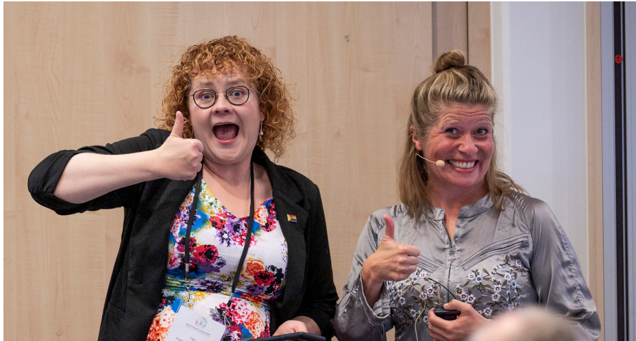
Svipmyndir af heimsþingi Húmanista Kaupmannahöfn // ágúst 2023